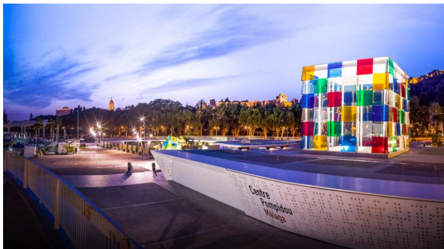
Centro Pompidou, en Málaga