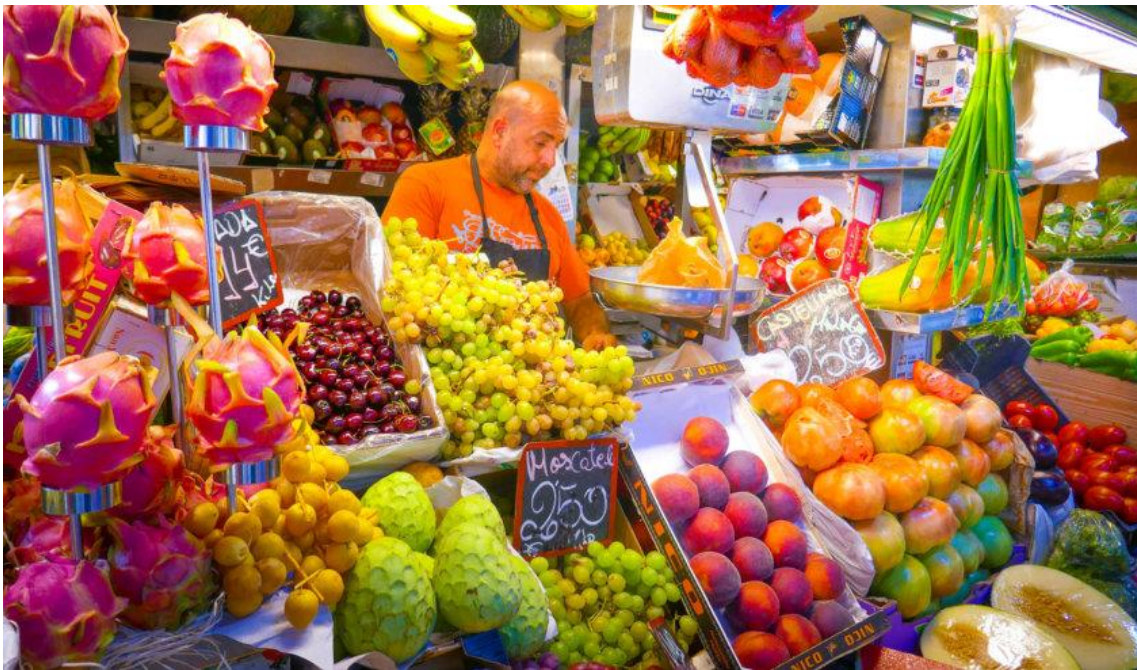
El mercado de Atarazanas en Málaga

El mercado está abierto de lunes a sábado, de 8:00 a 14:00 horas . Los domingos está cerrado .