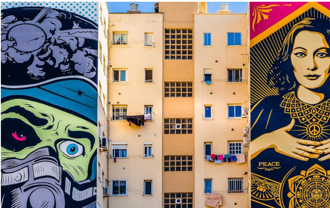
Arte callejero en el barrio del Soho, Málaga

En este barrio también encontrarás tiendas de artesanía , galerías de arte, restaurantes de cocina mundial y algunos bares de moda.